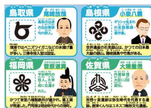
＜都道府県データ例＞