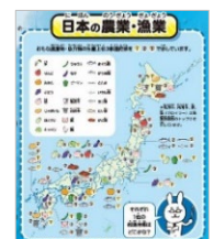
＜日本の農業・漁業＞

昭文社は今後、学習世界地図の刊行も予定しております。子どもたちが地理に関心を持ち、世界で活躍する基盤ができるよう、良質の地図・関連商品を企画してまいります。どうぞご期待ください。