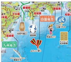
＜伝統的工芸品・祭の例＞