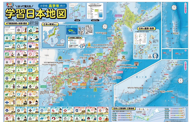
<左：小学校中学年用、右：小学校高学年用の各商品>