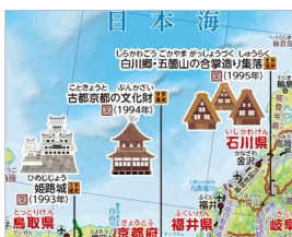
＜日本の世界遺産の例＞