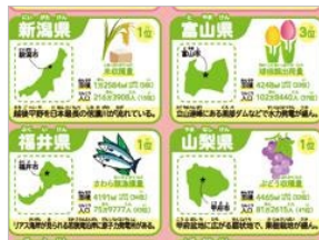
＜都道府県データ例＞