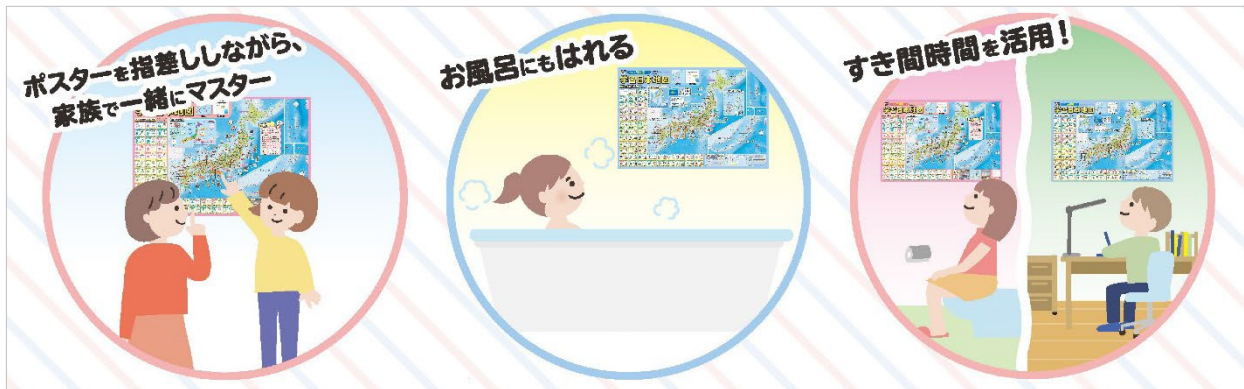
<「学習ポスター」活用イメージ>

視認性の高いイラストや文字、図表を採用し、地図・地理に親しめる工夫がいっぱいです。