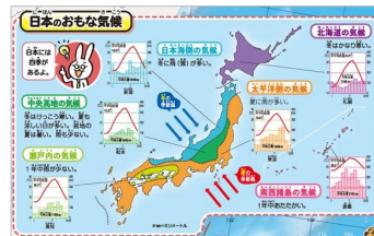
＜日本のおもな気候＞