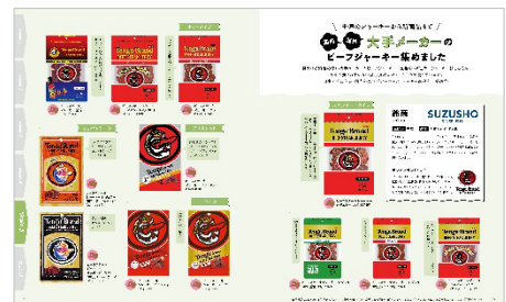
<「国内・海外 大手メーカーのビーフジャーキー集めました」>