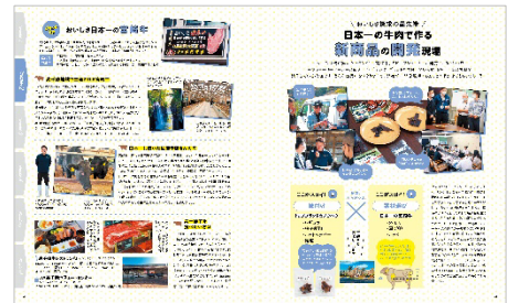
<「日本一の牛肉で作る新商品の開発現場」>