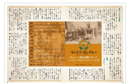
<人物列伝1 マハトマ・ガンディー>