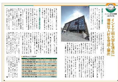
<インド工科大学を頂点に優秀な人材を育成・輩出>