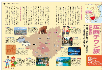
<広西チワン族自治区>