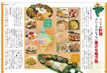
<インドの料理 カレーだけじゃない豊かな地方色>