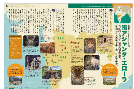
<世界遺産アジャンタ・エローラ>