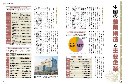
<中国の産業構造と主要企業>