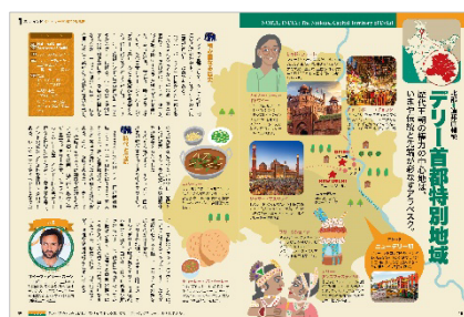
<デリー首都特別地域>