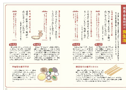
<飛鳥・奈良時代の食生活>