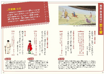
<飛鳥・奈良時代の恋と愛>