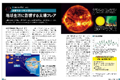
<地球生活に影響する太陽フレア>