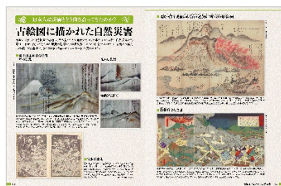
<古絵図に描かれた自然災害>

商品名 : 『自然災害のトリセツ ～地震・火山噴火・異常気象のしくみと備えがわかる本～』