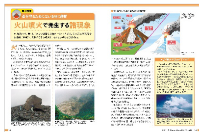
<火山噴火で発生する諸現象>