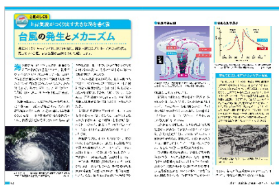
<台風の発生とメカニズム>