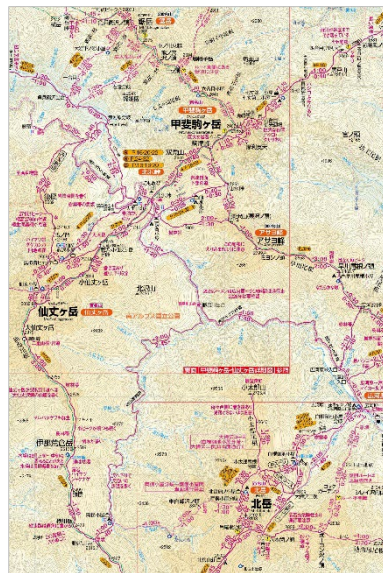
＜パッケージ（上面）とパズルになる地図（北岳・甲斐駒ヶ岳付近拡大）＞