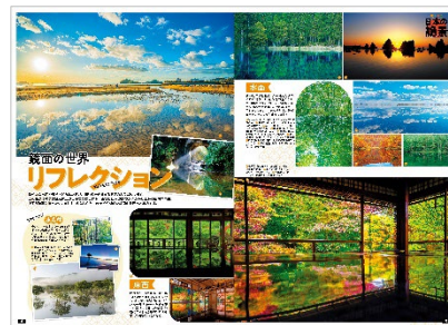
&lt;巻頭特集 日本の絶景「リフレクション」&gt;