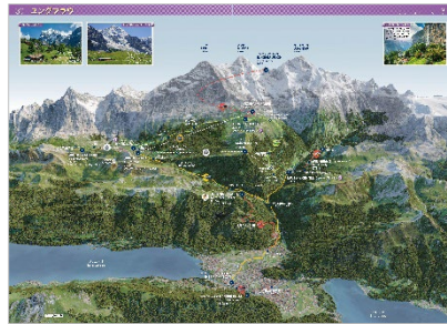
&lt;ビジュアル鳥瞰図「ユングフラウ」&gt;