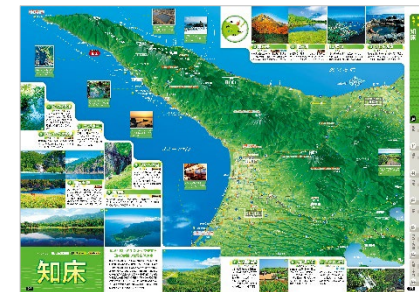
&lt;シリーズの人気を決定づけたイラスト鳥瞰図「知床」&gt;