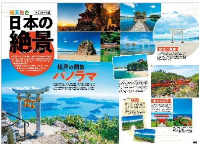
&lt;巻頭特集 日本の絶景「パノラマ」&gt;

◆ 地図会社のノウハウを結集 ：リアルな鳥瞰図、海底地形を投影させた離島詳細マップ、著名社寺の構内図など、さまざまなタイプのマップを贅沢に収録。