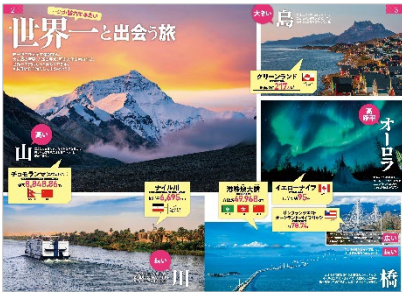
&lt;巻頭特集「世界一と出会う旅」&gt;

◆ 豊富なエリア特集 ：ヨーロッパの美術館めぐりや憧れのホテル、音楽家たちのゆかりの地、アジアの絶景遺跡、アジアリゾート、アフリカの国立公園、アメリカの4大プロスポーツリーグ、ソウル&ホノルルの楽しみ方まで完全網羅。