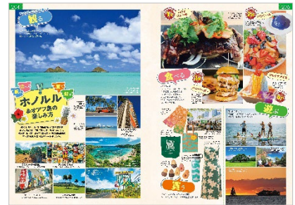
&lt;「ホノルル&amp;オアフ島の楽しみ方」&gt;