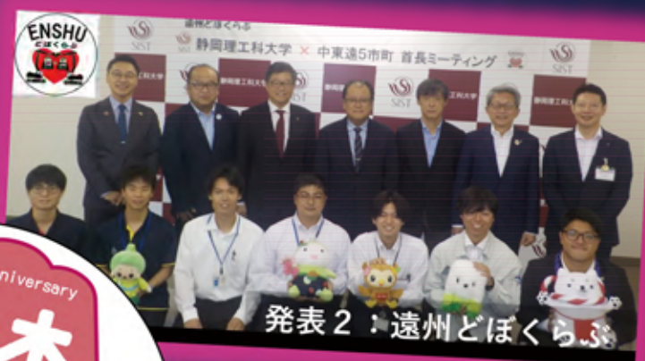
発表2：遠州どぼくらぶ