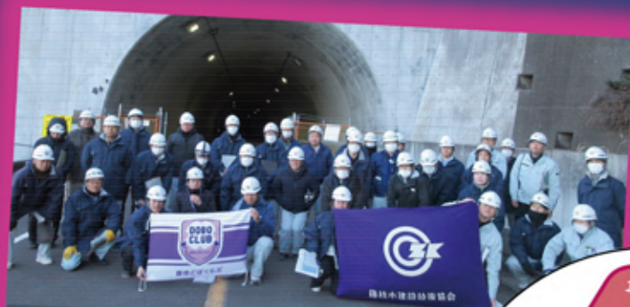
発表1：藤枝どぼくらぶ

今できることを皆で考え話し合い、新たな連携や相互扶助により、建設業界が抱える課題の改善に繋がるよう、土木LOVEの誇りと情熱で新しい土木技術者の世界をともに築いて参りましょう！