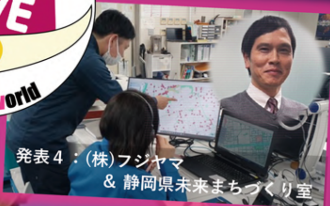
発表4：(株)フジヤマ & 静岡県未来まちづくり室