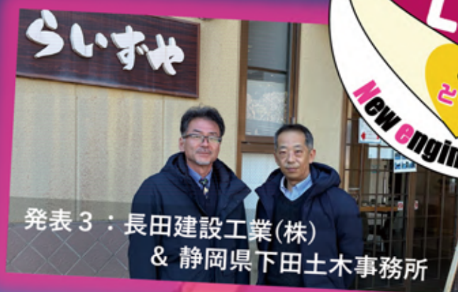
発表3：長田建設工業(株) & 静岡県下田土木事務所