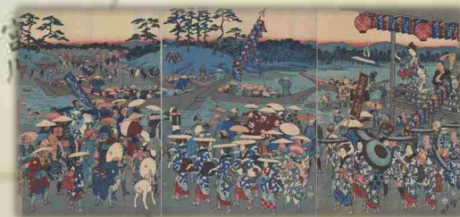
▶ 錦絵 伊勢参宮宮川の渡し