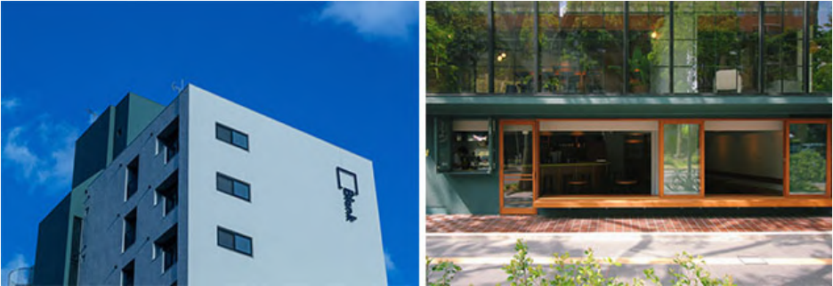
左) Blank外観デザイン、右) Cafe・Local Lounge 正面ファサード、テラス外観

選べるSOHO&アパートメント、ホテル、ワークスペース、シェアラウンジ、地域に開いたカフェ、イベントスペースからなる複合施設。東北初となる築46年の元分譲マンションを用途変更し、一棟丸ごとコンバージョン。