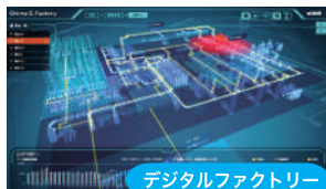
デジタルファクトリー

DX推進のリーダーとして各種プロジェクトを推進中。またエバンジェリストとしてDX講演活動を実施。