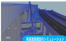
高速道路建設のシミュレーション