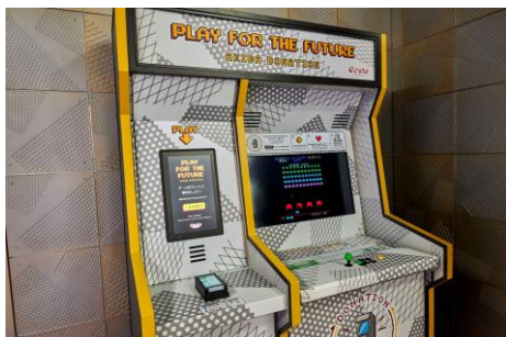
<PLAY FOR THE FUTURE -AKIBA DONATION-> 1プレイ/200円、500円、1,000円選択制 ※キャッシュレス決済のみ JR秋葉原駅（改札内1F）2箇所に設置

エキュート秋葉原の開業以来、40～50代の方はレトロゲームの懐かしさに足を止め、複数回プレイする方も多く見受けられ、10～20代の若い世代の方は友人同士でプレイ中の様子を撮影するなど、アーケードゲームの体験自体を多くの方に楽しんでいただいています。今回、開業日から2026年3月31日までの約1年間にご利用いただいたプレイ料金は総額3,057,900円となりました。