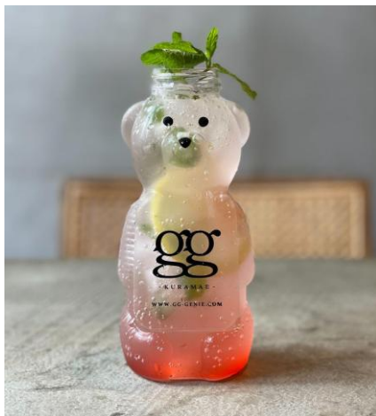
レモネードソーダ

爽やかな梅の酸味とコーヒーのほろ苦さが炭酸とともに広がる、初夏にぴったりのスパークリングドリンク。すっきりとした後味をお楽しみください。