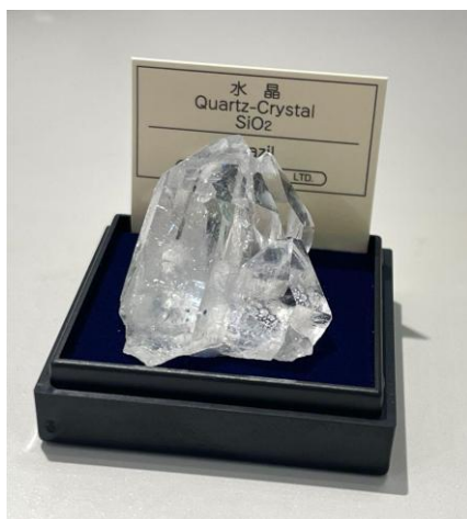
ミニ鉱物標本 水晶