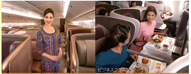
ビジネスクラスシート

※バススタブ付客室をリクエストしておりますが、シャワーのみの客室となる場合があります。 ※客室カテゴリと景観指定はできません。