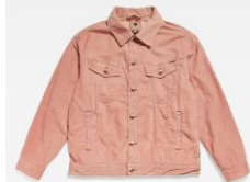
Oversized Western Jacket ¥28,600