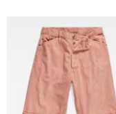
Bam Short ¥20,900