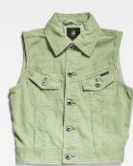
Slim Denim Vest ¥22,000