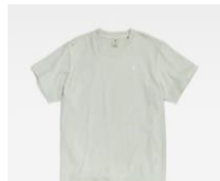
Oversized T-shirts ¥8,800