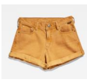
Judee Shorts ¥17,600