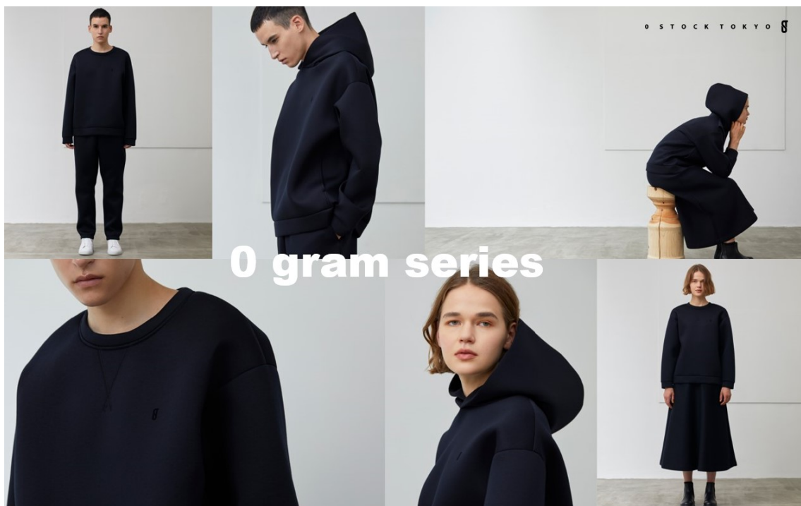
0 gram series

https://zerostocktokyo.com/collections/0-gram-series