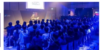
<VIDEOGRAPHERS TOKYO 2022 (2022 年 6 月)の様子>