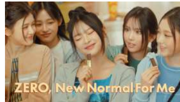
HANNI) ZERO New Normal For Me