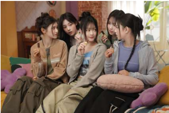
「This is おいしいZERO チョコ篇」

レトロっぽさがありつつもモダンな小物が置かれた部屋をイメージしたスタジオで実施された本TVCMの撮影。チルしているかのようにリラックスした様子で撮影に臨んでいたNewJeansの5人。テーブルの上に置かれたたくさんの『ZERO』を見ながら、「これが好き!」など楽しそうに話していました。