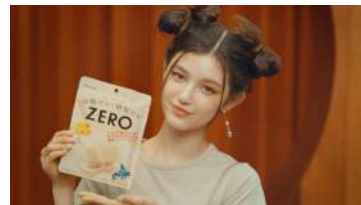
ALL) This is おいしいZERO!