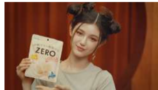
ALL) This is おいしい ZERO!