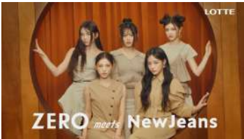
ALL) ZERO meets NewJeans!

「ZERO meets NewJeans」の掛け声とともに、ファッションムービーのようにスタイリッシュでクールな衣装に身を包み、クールな表情で決めるNewJeansのメンバーたち。しかし一転、自宅リビングのような空間に集まり、テーブルいっぱい広がった『ZERO』のお菓子を眺めながら、どれにするか悩んでいます。テーブルから選んだチョコレートの「ゼロ」のパッケージを取り、「ZERO is Free & Easy」と2人で決めポーズをするMINJIとHYEIN。そしてDANIELLEとHAERINは「ZERO is Sweet & Happy」と中身のチョコレートを取り出して、乾杯。最後に「ZERO, New Normal For Me」とチョコレートを食べて幸せそうな表情をするHANNIを4人が優しく見つめます。最後はメンバーごとに様々な『ZERO』ブランドの商品を持ちながら自然体な笑顔で「This is おいしいZERO」と締めくくるのでした。