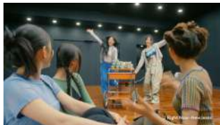
MINJI + HANNI) Let's ZERO !!!!