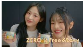
MINJI + HANNI) ZERO is Free & Easy