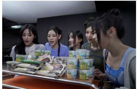
「This is おいしいZERO アイス篇」

レトロっぽさがありつつもモダンな小物が置かれた部屋をイメージしたスタジオで実施された本TVCMの撮影。チルしているかのようにリラックスした様子で撮影に臨んでいたNewJeansの5人。テーブルの上に置かれたたくさんの『ZERO』を見ながら、「これが好き!」など楽しそうに話していました。