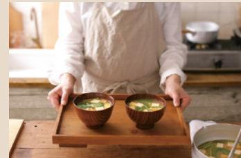
・試食モニターへのご参加