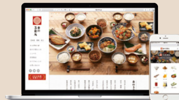
・メールマガジンのお届け

さまざまな特典・イベントを通じて、認定製品・認定企業への感想をいただいています。