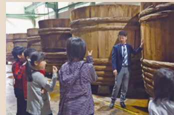
・認定企業訪問ツアー