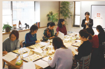
・認定製品の試食会・意見交換会