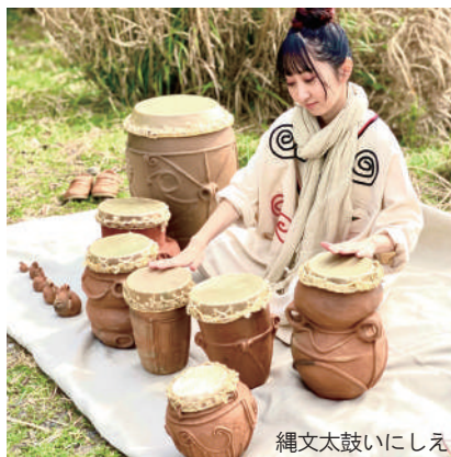
縄文太鼓いにしえ