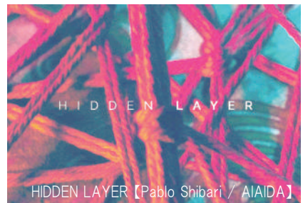
HIDDEN LAYER [Pablo Shibari / AIAIDA]