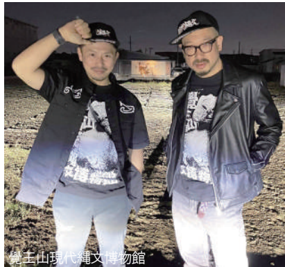
島山現代縄文博物館