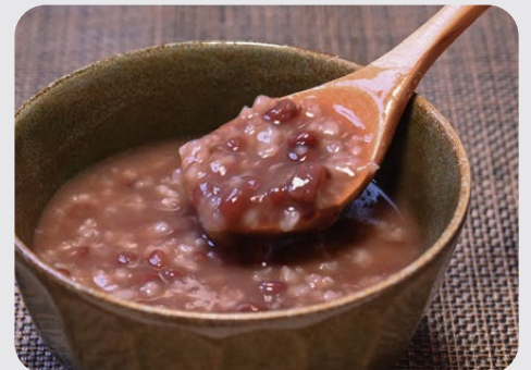
岩船産コシヒカリ100%と北海道産あずきを使用。夏は冷たいままおすすめ

「とりがらほたて」や「黒米」等の具材入りのおかゆや雑炊など、幅広い商品ラインナップの中でも、最近人気を博しているのが「コシヒカリぜんざい」です。餅をおかゆにすることで、高齢者なども気兼ねなく食べることができ、袋のまま電子レンジで加熱できる手ごろさも魅力。