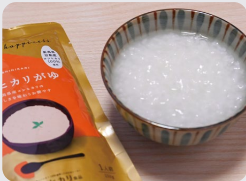
「コシヒカリがゆ」はスタンダードな白がゆ。岩船産コシヒカリを100%使用

ヒカリ食品のおかゆはお米と水が命。おいしいおかゆのための精米にもこだわっています。新潟県産コシヒカリと五泉の清らかな水で作るおかゆは保存料も不使用。雑味がなく、お米の優しい甘さを感じられます。