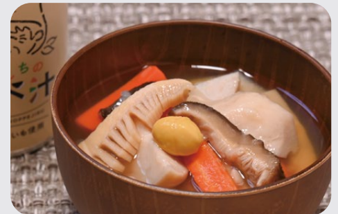
ラポルテ五泉で購入可能。価格は698円

ラポルテ五泉にある直売所「メルカートごせん」とコラボした「おめさんちののっぺ汁」は五泉のサトイモと国産野菜を使った缶入りののっぺ汁。大きな具材と上品な出しの味わいが特徴で、五泉みやげとして好評を博しています。