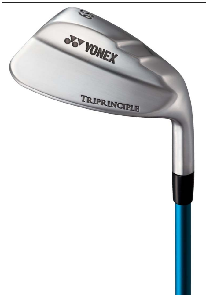
↑ TRIPRINCIPLE(トライプリンシプル)ウェッジ

は、ヒール側を段差状に削りバンスを無くした新ソール形状を採用によって振りぬきが格段に向上します。また、多くのプロが自然に寄せのアプローチやバンカーショットで実践する、ピン目標の角度方向性1：2法則に基づいたスイングが容易にできる新デザインのフェース面といたしました。そして、シャフトはスイング軌道が安定する硬・重カーボンシャフトを採用。スチールシャフトよりも硬さを大幅にUPさせた低トルクのシャフトとすることでヘッドのブレを軽減、インパクトの正確性を高めます。シャフト中間層にはタングステン複合プリプレグを搭載することで、一般的なスチールよりも重くなり、スイング軌道を安定させ、正確なアプローチを実現します。