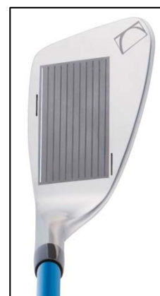
↑ TRIPRINCIPLE(トライプリンシプル)ウェッジのフェース面