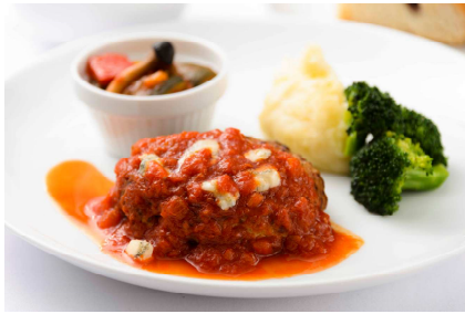
La bettola のハンバーグプレートゴルゴンゾーラ 入りトマトソース 1,925 円 (税込) ※11:00~L.O.22:00

成田シェフが監修したソースをからめた「ハンバーグ」をリーズナブルな価格で堪能できます。