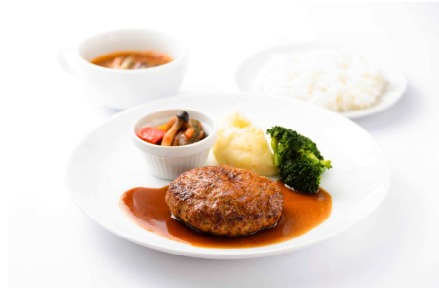
La bettola のハンバーグプレート フォンドヴォーと レフォールのソース 1,925 円 (税込) ※11:00~L.O.22:00