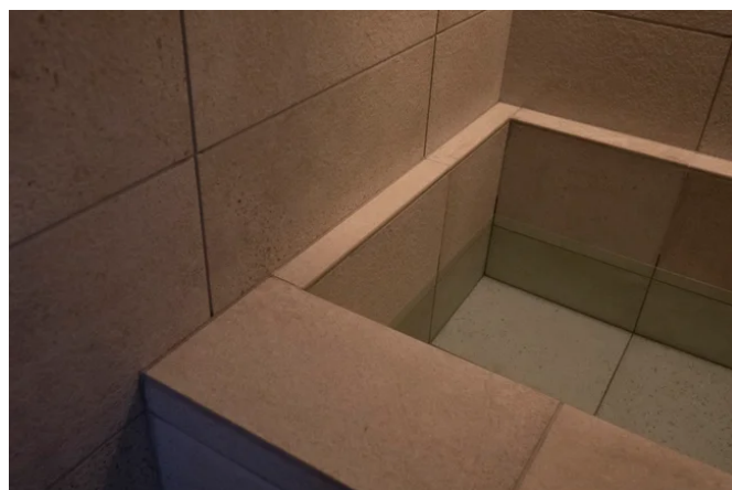
肩まで浸かれる水風呂