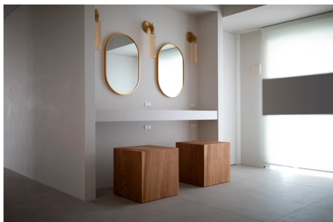
上質なアメニティが揃うパウダールーム