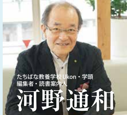
たちばな教養学校 Ukon・学頭 編集者・読書案内人

皆さんに親しまれ、「そこにある」こと自体が喜ばれる、そういう学校をめざします。3人の講師の方々は、Ukon がめざす方向を、それぞれに示してくださいる人たちです。是非じっくりと味わってお聴きいただきたいと思います。