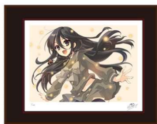
▲版画2（額サイズ:H394×W509mm） 税込41,800円