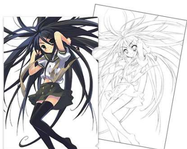
▲アート付クリアファイル 税込1,100円