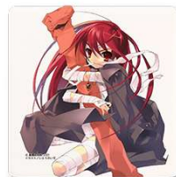
▲アートタイル 各 税込1,000円