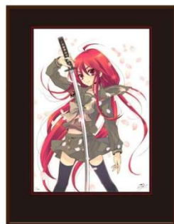
▲版画3 （額サイズ:H509×W309mm） 税込41,800円