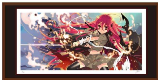
▲版画1（額サイズ:H300×W600mm） 税込46,200円