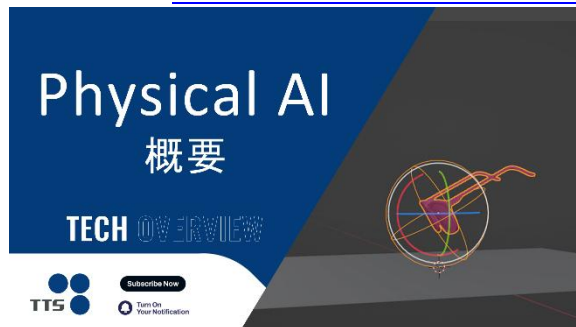
Physical AI 概要”

チャンネル： https://youtube.com/@tts_techlab?si=fPhWTnIhNKMAHo7r