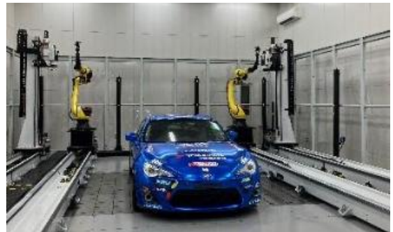
TTS 厚木テクニカルセンターの様子

東京貿易テクノシステム株式会社 ホームページ： https://www.tbts.co.jp/ オフィシャル YouTube： https://www.youtube.com/@tbts_official