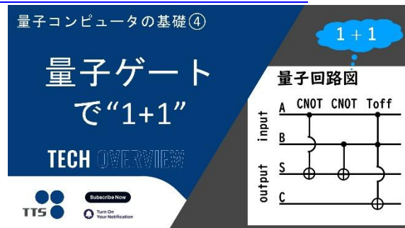
量子コンピュータの基礎④ 量子ゲートで“1+1”