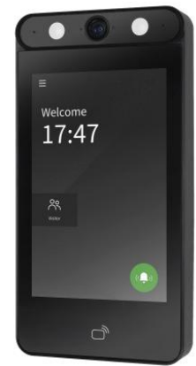
7インチ顔認証リーダー 「WFT-1670」

ティービーアイは今後もセキュリティソリューションの高度化を進め、安全・安心な社会の実現に貢献してまいります。