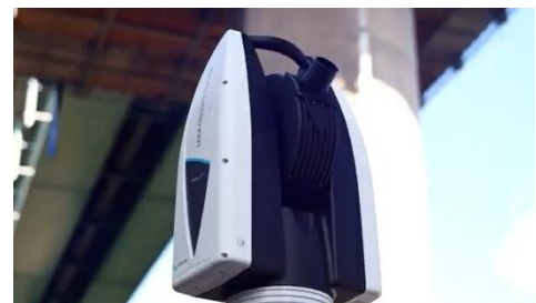
Leica Absolute Tracker ATS600

本技術は、河川点検技術カタログにおいて、河川構造物の状態把握や施工管理に資する「計測・モニタリング技術」分野の一つとして「計測-22」に掲載されています。