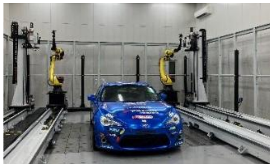
TTS 厚木テクニカルセンターの様子

東京貿易テクノシステム株式会社（TTS）は、三次元測定機やレーザートラッカーなどの高精度な計測機器を提供し、製造業のスマートマニュファクチャリングを支援する企業です。主な事業は、計測機器の販売・技術サポート・ソフトウェア開発・エンジニアリングサービスで、自動車業界、建築業界、鉄鋼業界などの大手メーカーから航空宇宙、重工業、研究機関まで、ものづくりの現場における製品の設計、品質管理、製造プロセスの最適化を支援しています。