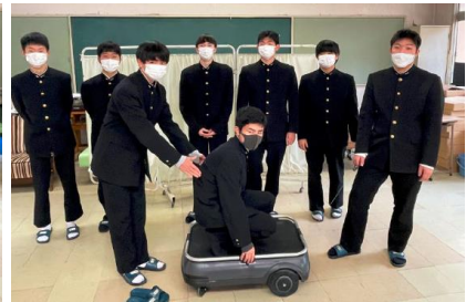
宇部工業高校 3年 電子機械科(左から1班、2班、3班) ※選考結果発表用として学校様から提供

(その他の結果は、大会事務局 HP に掲載 https://kenkyu.yamaguchi-u.ac.jp/chizai/?p=6819 )