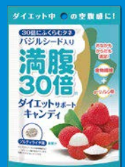
ソルティライチ味